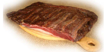
PANCETTA DI CINGHIALE STESA OLTRE 3 MESI

CINGHIALE, CERVO, CAPRIOLO, DAINO, CAMOSCIO, DINDO SPECK, OCA, CAPRA, AGNELLO, MUFLONE, BISONTE