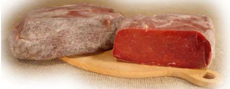
PROSCIUTTO DI CINGHIALE STESO OLTRE 4 MESI